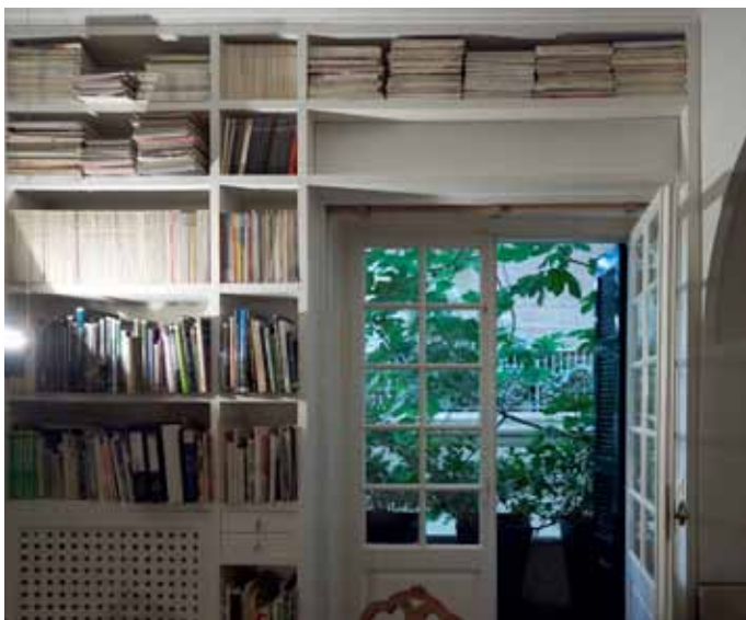
5 Zege工作室的阳台 门外自然的绿意盎然，舒缓工作的紧张气氛。

Zege ：建筑不仅仅是一项职业。它是一种激情，对生活的，创造的，交流和沟通的。所有这些能激发创意和想像力。激情是生活的艺术。建筑跟其他行业一样，得到什么取决于你的付出。如果只是把它当成一份工作，很可能过几年就放弃。如果你的选择是发自内心，是希望通过它让生活更美好，那才可能一直做下去。■