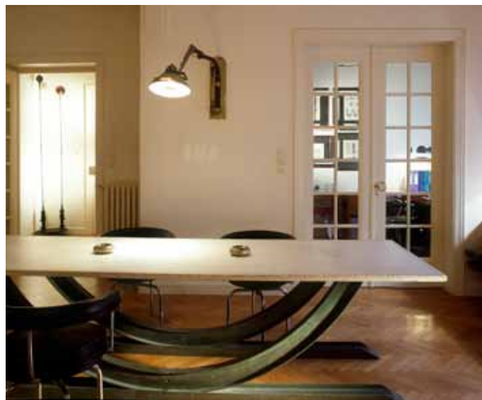
6 工作室一角 桌子腿很有特点。