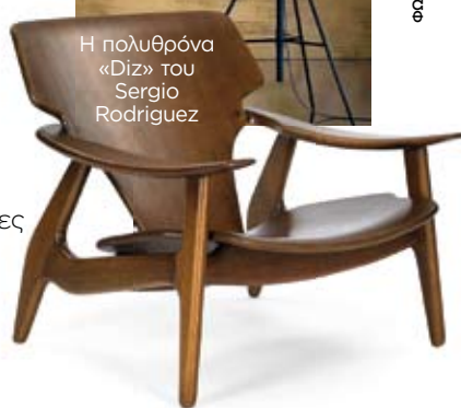
Η πολυθρόνα «Diz» του Sergio Rodrigues