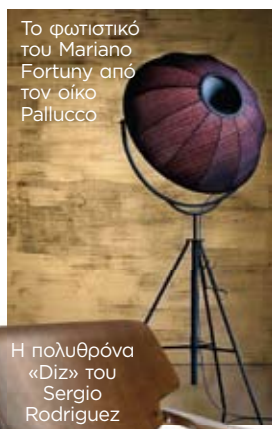
Το φωτιστικό του Mariano Fortuny από τον οίκο Pallucco

ΟΙ ΜΕΤΑΛΛΙΚΕΣ απλές της Charlotte Perriand της «CP1».