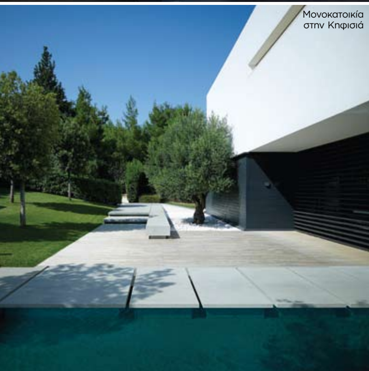
Μονοκατοικία στην Κηφισιά