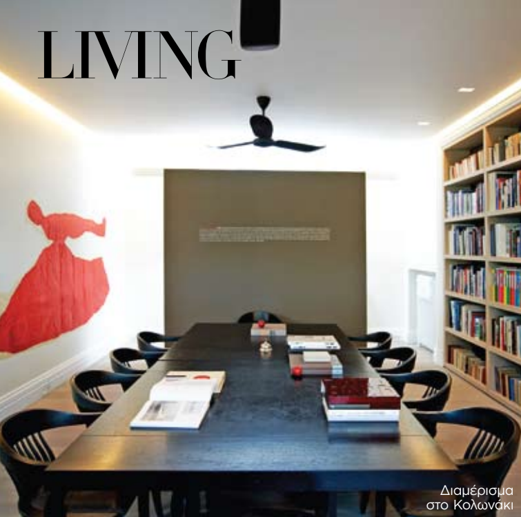
Διαμέρισμα στο Κολωνάκι