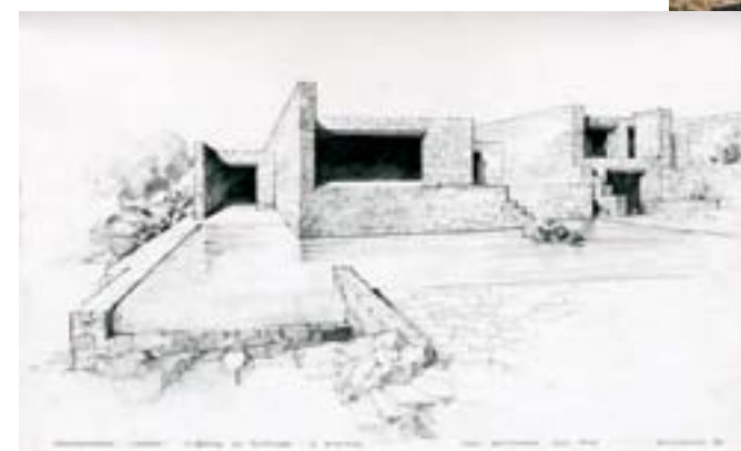
Από αριστερά και δεξιόστροφα: Βεράντα και κήπος κατοικίας στο Ιόνιο. Εξωτερικός χώρος από κατοικία στη Σίφνο. Γωνίες από το εντυπωσιακό The Met στη Θεσσαλονίκη.