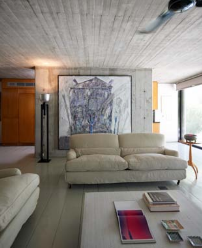
Από πάνω αριστερά και δεξιόστροφα: Άποψη από κατοικία στο Καβούρι. Οι δυο αρχιτέκτονες δπλώνουν την προτίμησή τους σε υλικά που δίνουν ύψος και ψυχή στο χώρο. Πρόσωση κατοικίας στο Ψυχικό και λεπτομέρεια από το εσωτερικό της. Κήπος στην Εκάλη.