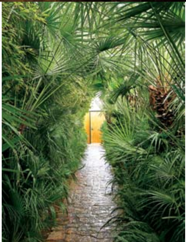
Από πάνω αριστερά και δεξιόστροφα: Κατοικία στο Ντράφι. Λεπτομέρεια από κήπο κατοικίας στα Νότια Προάστια. Σεβασμός στην παραδοσιακή αρχιτεκτονική σε εξοχική κατοικία στην Τήνο.