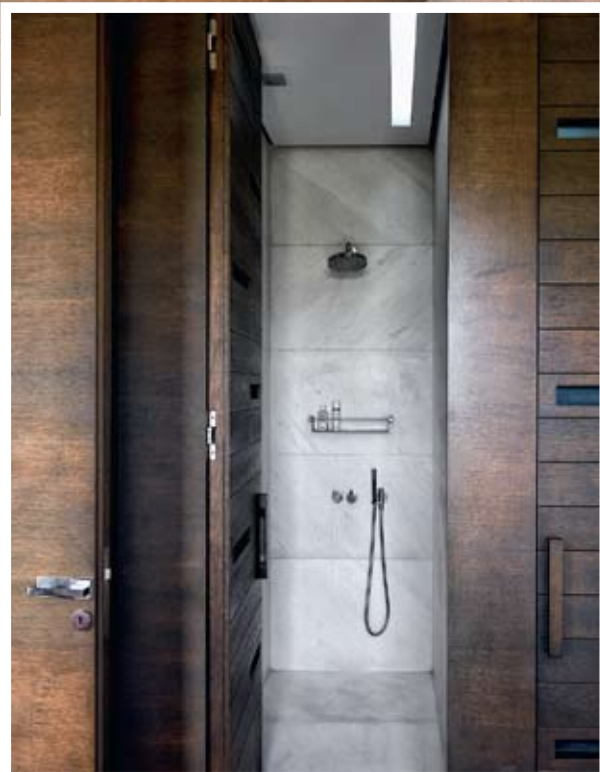
En-suite facilities στην κρεβατοκάμαρα και λεπτομέρεια του μπάνιου στο οποίο πρωταγωνιστεί η αντίθεση σκούρου και λευκού ξύλου.

που μοιάζουν με φυσικά κάδρα. Το κρεμαστό τζάκι πρωταγωνιστεί στο χώρο και σε συνδυασμό με την οριζόντια ειδική κατασκευή στο κάτω μέρος του επιτρέπει ανεμπόδιστα τη θέαση του κτιρίου της Βουλής και του κήπου. Στη θέα συνηγορούν και τα ευρύχωρα υπαίθρια καθιστικά, τα οποία είναι σε άμεση επαφή με την κουζίνα, που βρίσκεται σε ξέχωρη περιοχή του ορόφου για τη σωστή και αυτόνομη λειτουργία της. Για τη δημιουργία καθαρών επιφανειών και την ενοποίηση των χώρων, οι αρχιτέκτονες χρησιμοποίησαν ενιαία δρύινα πατώματα και κοινό χρωματισμό στις ξύλινες επενδύσεις και σε όλα τα εσωτερικά κορυφώματα. Στον κάτω όροφο, επιλέχθηκε μια πιο κλασική διαρρύθμιση, με το υπνοδωμάτιο και την κουζίνα να είναι απομονωμένα από τον κυρίως χώρο του καθιστικού και της τραπεζαρίας. Εδώ βασικό ρόλο στη δημιουργία ατμόσφαιρας παίζει η ύπαρξη της βιβλιοθήκης που μαζί με τα δύο τραπέζια της MDF, τις καρέκλες της Arper και τα φωτιστικά της Light Years ανατρέπουν την κλασική αντίληψη και διάταξη της τραπεζαρίας. Η πολυτέλεια στα μπάνια δηλώνεται από την αντίθεση των σκούρων ξύλων με τα λευκά μάρμαρα Carrara. Τα δύο διαμερίσματα επικοινωνούν με μία γραμμική ξύλινη σκάλα με ελεύθερα πατήματα, η οποία στο κάτω μέρος της φιλοξενεί ένα γραφείο.