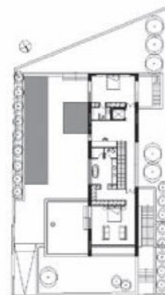
Κάτοψη β' ορόφου