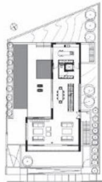
Κάτοψη α' ορόφου