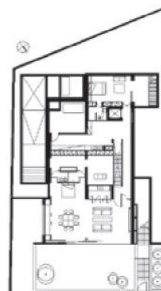
Κάτοψη ισογείου - α' υπογείου