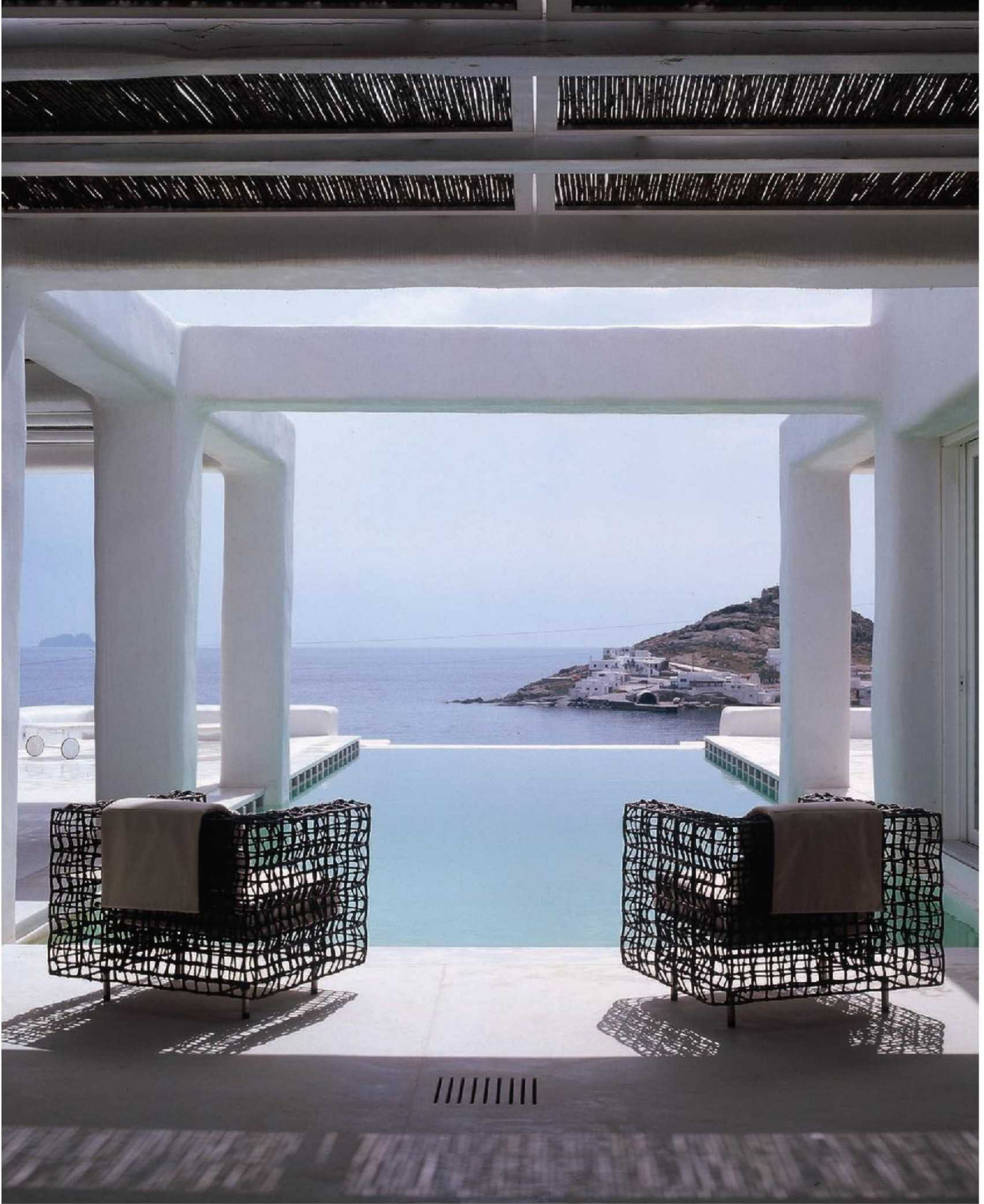
جلسة في التراس حيث تظهر مياه الخليج في الأفق كامتداد بلا نهاية لحمام السباحة. الصفحة المقابلة أعلى يسار بين الطابقين يمتد سلم من الخرسانة المصبوبة والتي تركت بكل تمويجاتها الطبيعية ليبدو كأنه منحوت في المكان. أسفل يسار الحمامات الصغيرة المساحة زودت بأفكار وحلول عملية.