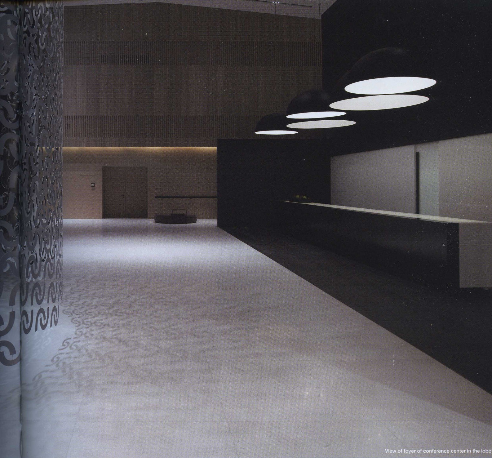
View of foyer of conference center in the lobby