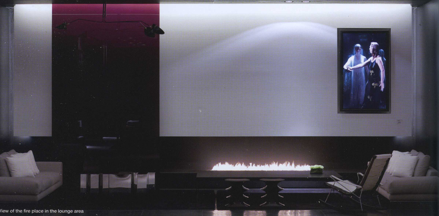
View of the fire place in the lounge area