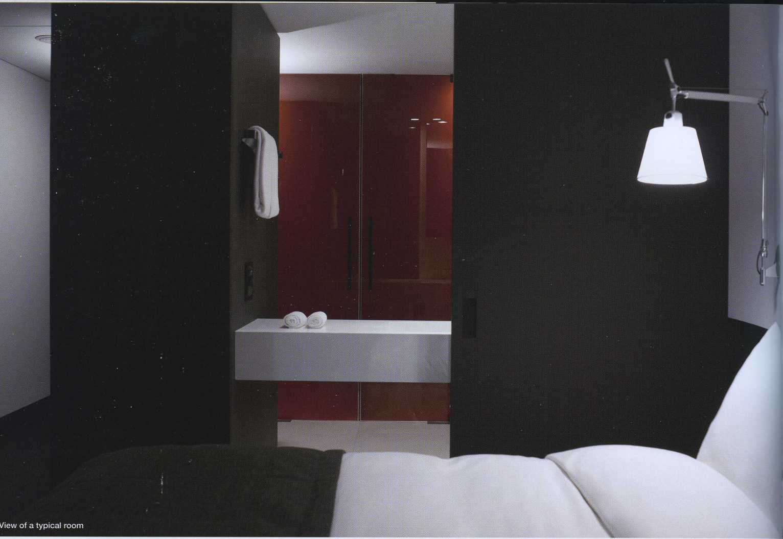
View of a typical room