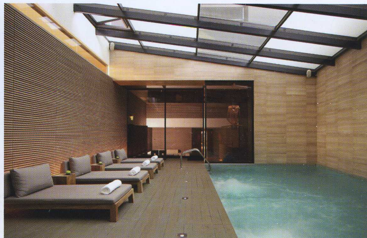
View of the spa swimming pool