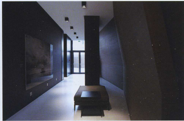
View of the lobby corridor