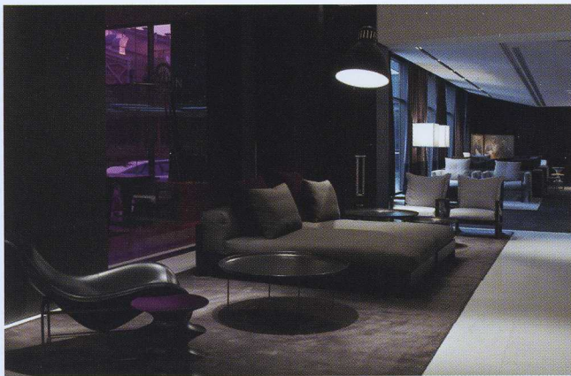
View of lounge area in the lobby